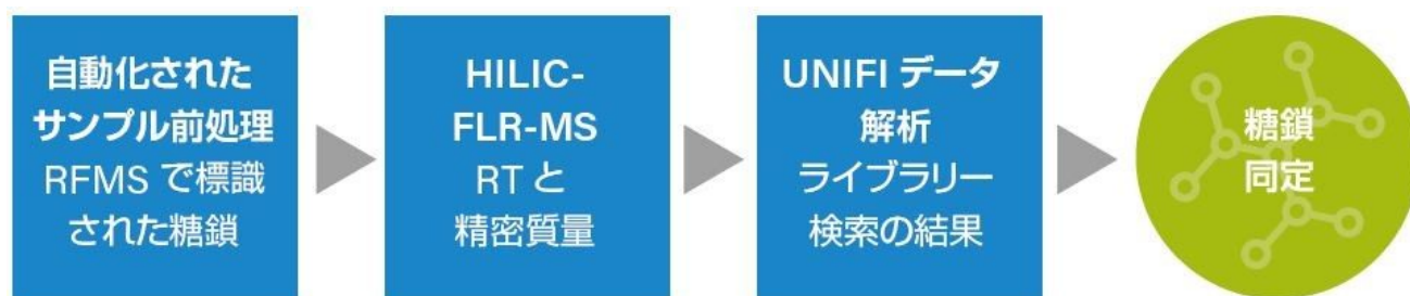
図 2. UNIFI 科学情報システムを搭載した BioAccord システムによる糖鎖解析ワークフロー