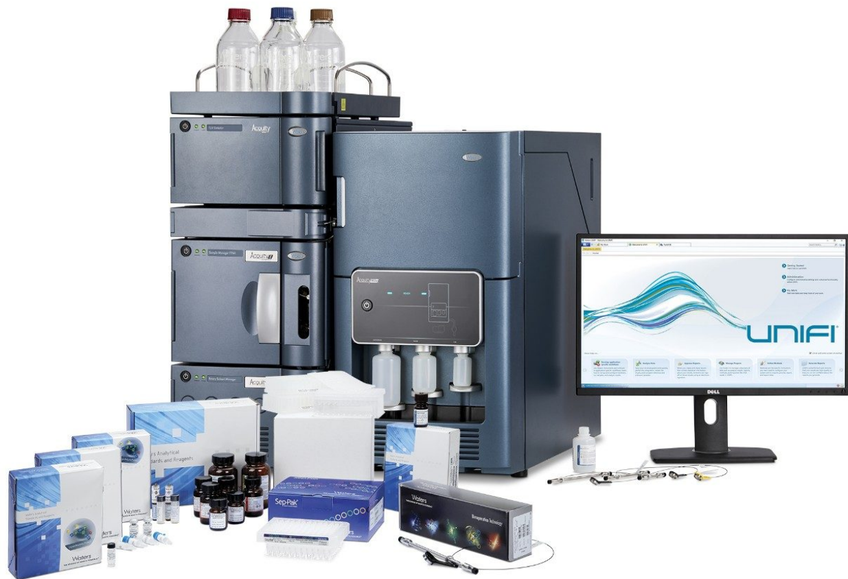
図 1. 自動化 GlycoWorks RapiFluor-MS N-Glycan キットおよび UNIFI ソフトウェア搭載の BioAccord システムによる糖鎖アプリケーションソリューション

一方、高分解能 MS を使用した複雑な糖鎖サンプルの分析には、通常、装置の操作、メソッドの最適化、およびデータの解釈に精通しているユーザーが必要となります。そのため、ラボでの信頼性と生産性を向上でき、かつ容易に展開できる相補的な検出機能を持ったワークフローは、バイオ医薬品業界において強く求められています。