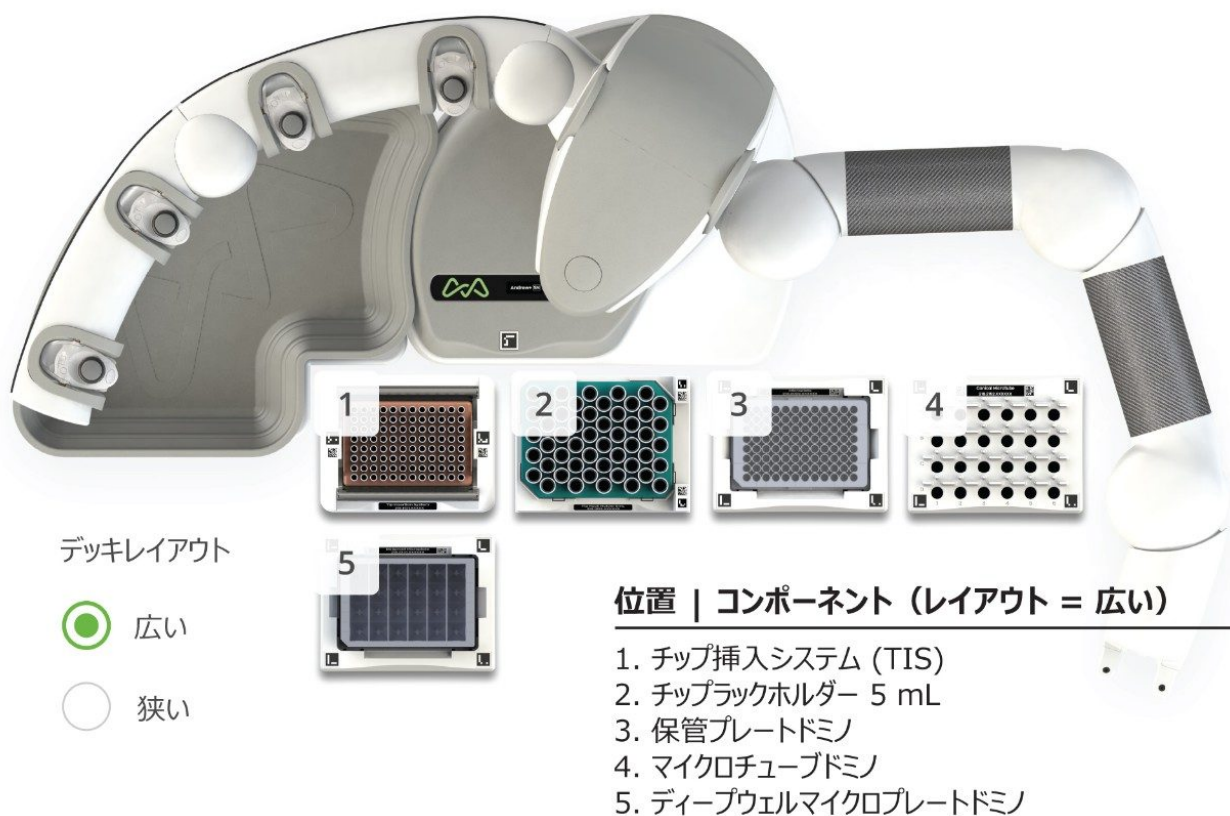
図 1. 連続サンプル希釈および検量線作成用の Andrew+ ピペッティングロボットのデッキレイアウト

低分子分析法開発ガイドンス 3,4 に従って開発した分析法は、直線性（相関係数 ( R^2 ) 0.98以上）、正確度（±15%）および精度（±15%）を実証できる必要があります。これらの基準は、Andrew+ ピペッティングロボットで行った OneLab サンプル調製法およびとそれに続く LC-MS 分析で、6 つの N- ニトロソアミン不純物すべてについて容易に達成されました。平均（ N=3 ）キャリブレーション性能が表 1 に示されています。6 種類の N- ニトロソアミン不純物すべてについて、リニアダイナミックレンジは 0.025 ~ 50 ng/mL で、単純な 1/x 重み付けを用いた線形回帰は 0.999 以上でした。さらに、平均正確度値は 90.7 ~ 108.0% の範囲で、RSD は 0.2% ~ 14.0% であり、高度に正確で再現性の高い方法であることが示されています。図 2 に、ニトロソアミン不純物 6 種のうち 3 種の代表的な検量線が示されています。