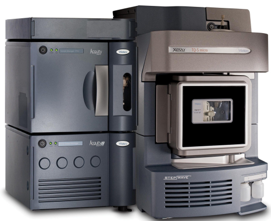
图1. Waters ACQUITY UPLC I-Class Plus/Xevo TQ-S micro联用系统。

本文介绍了一种临床研究方法，该方法使用了Waters MassTrak类固醇血清套装2和3、标准曲线样品和QC样品，以及Waters Oasis™ PRiME HLB μElution板技术。其中，将Oasis™ PRiME HLB μElution板技术与Hamilton™ Microlab STAR液体处理器配合使用，以自动化的方式提取血清样品中的睾酮、雄烯二酮、17-羟孕酮(17-OHP)、脱氢表雄酮硫酸盐(DHEAS)、皮质醇、11-脱氧皮质醇和21-脱氧皮质醇。色谱分离使用配备ACQUITY UPLC HSS T3 Vanguard™保护柱和ACQUITY UPLC HSS T3色谱柱的ACQUITY UPLC™ I-Class Plus (FL-I)系统，与Xevo™ TQ-S micro质谱仪联用（图1）。